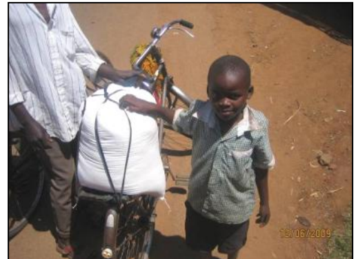
Beeld van de voedselhulp in 2009

Ik ben enorm dankbaar voor alle kansen die ik heb gekregen doordat iemand in Nederland mij is gaan sponsoren. Ik hou van mijn sponsor en bid voor hem!