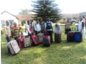
de trotse eigenaren van een nieuwe koffer

Er waren workshops over 'werken, sparen & investeren', 'studievaardigheden & timemanagement', 'seks & relaties'.